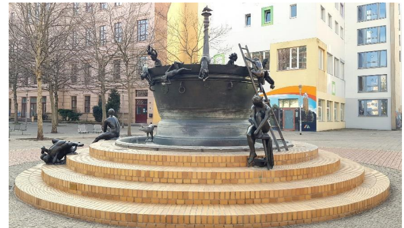
Faunbrunnen in der Leiterstraße

Startunterlagen und Wertungsstempel: Deutsche Jugendherberge Magdeburg Leiterstr. 10, 39104 Magdeburg Tel.: 0391 532 1010